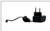
Cable 100-240 Vac