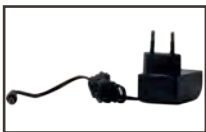
Cable 100-240 Vac