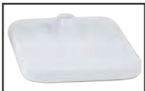
Pie Mercurio Mercurio lamp foot