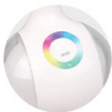
Panel de control Control Panel