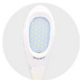
Luz funcional Functional light 3 niveles de intensidad 3 brightness levels