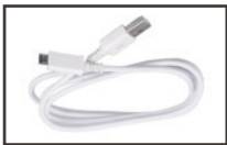
Cable Micro USB