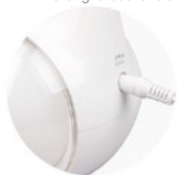
Conexión Port Micro USB